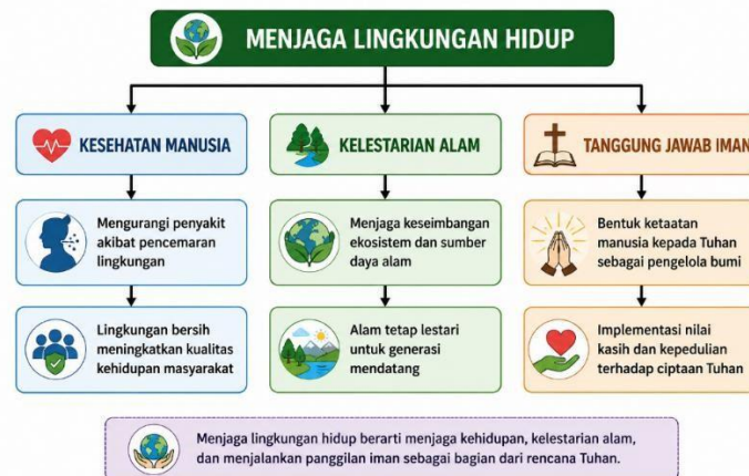
Diagram 1. Hubungan Alasan Menjaga Lingkungan Hidup

Diagram ini menunjukkan bahwa alasan mahasiswa menjaga lingkungan hidup tidak hanya dipengaruhi oleh kebutuhan kesehatan dan kelestarian alam, tetapi juga oleh nilai spiritual. Mahasiswa memahami bahwa menjaga lingkungan merupakan bagian dari tanggung jawab iman Kristen.